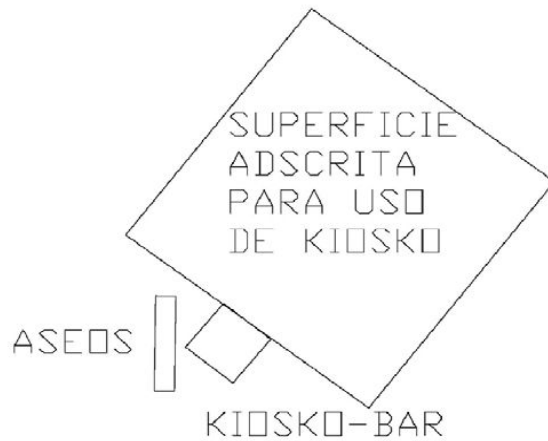
Instalaciones completas que conforman los kioscos